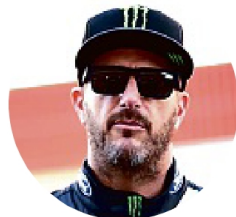
Ken Block tinha 55 anos

Block já foi considerado uma das maiores promessas