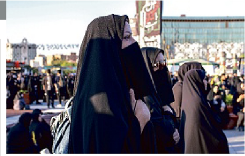
Mulheres iranianas têm se revoltado contra o uso obrigatório do véu

OPRESSÃO No dia 24 de dezembro, o Talibã proibiu o trabalho de afegãos em ONGs locais e internacionais, gerando reação da comunidade internacional, além de uma forte oposição no país. A medida também expõe as divisões que atravessam o movimento talibã, enquanto o Afeganistão continua a se afundar em uma grave crise. Em caso de recusa a se submeter a essas novas regras, as ONGs terão suas licenças revogadas, o que as impediria de continuar a exercer suas atividades no Afeganistão. As ONGs são, muitas vezes, a única esperança para a melhora de vida de meninas e mulheres afegãs.