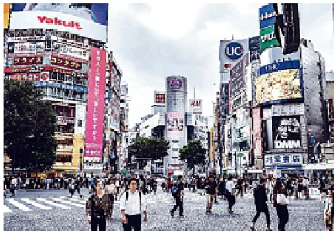
Tóquio: moradores são incentivados a migrar para outras cidades

O pagamento, que se soma a um apoio financeiro já disponibilizado pelas autoridades de até 3 milhões de ienes, será oferecido a famílias que vivem nas 23 alas "centrais" de Tóquio e nas prefeituras vizinhas de Saitama,